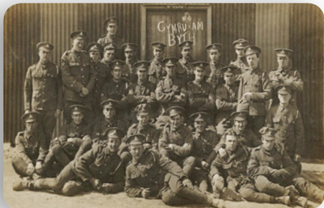
Ffotograff o gatrawd Gymreig yn ystod y Rhyfel Byd Cyntaf yn sefyll o flaen drws gyda'r geiriau 'Cymru am Byth' arno

Mae'r wefan yn eich galluogi i chwilio drwy holl gynnwys ein casgliad ar-lein, ac yn bwysicach fyth, i gyfrannu deunydd a chreu eich stori ddigidol eich hun. Jig-so yw stori Cymru, ac mae gan bawb ddarn bach ohono, boed yn atgof, llythyr neu hen ffotograff. Eitemau yw'r rhain sy'n aml yn cael eu anghofio, eu colli neu eu taflu, ac mae eu rhannu ar Gasgliad y Werin Cymru yn help i gyfoethogi treftadaeth ddiwylliannol Cymru a'i chadw i genedlaethau'r dyfodol.