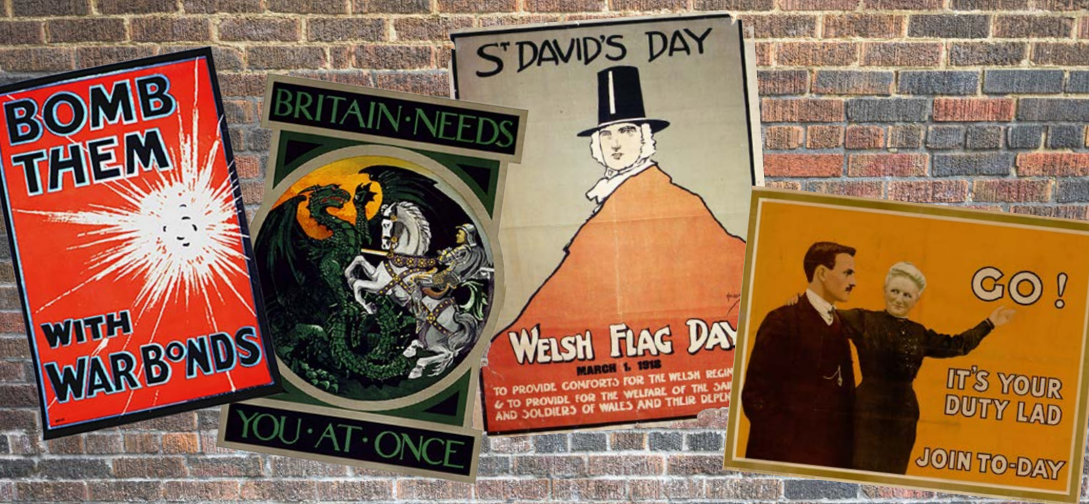
(uchod) Mae'r posteri yma'n ran o'r arddangosfa 'Posteri'r Rhyfel Byd Cyntaf: angerdd, propaganda a phatrwm i ddylanwadu ar genedl'. (cefnidir) Medwyn yn Cofio.