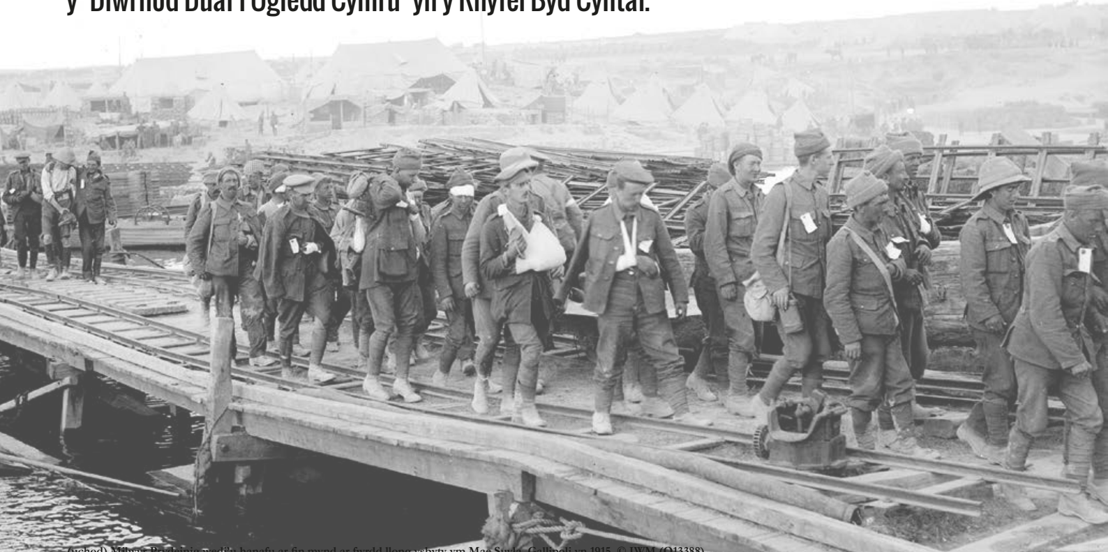
(uchod) Milwyr Prydeinig wedi'u hanafu ar hiri mynd ar fwrdd llong ysbyty ym Mae Suvla, Gallipoli yn 1915.