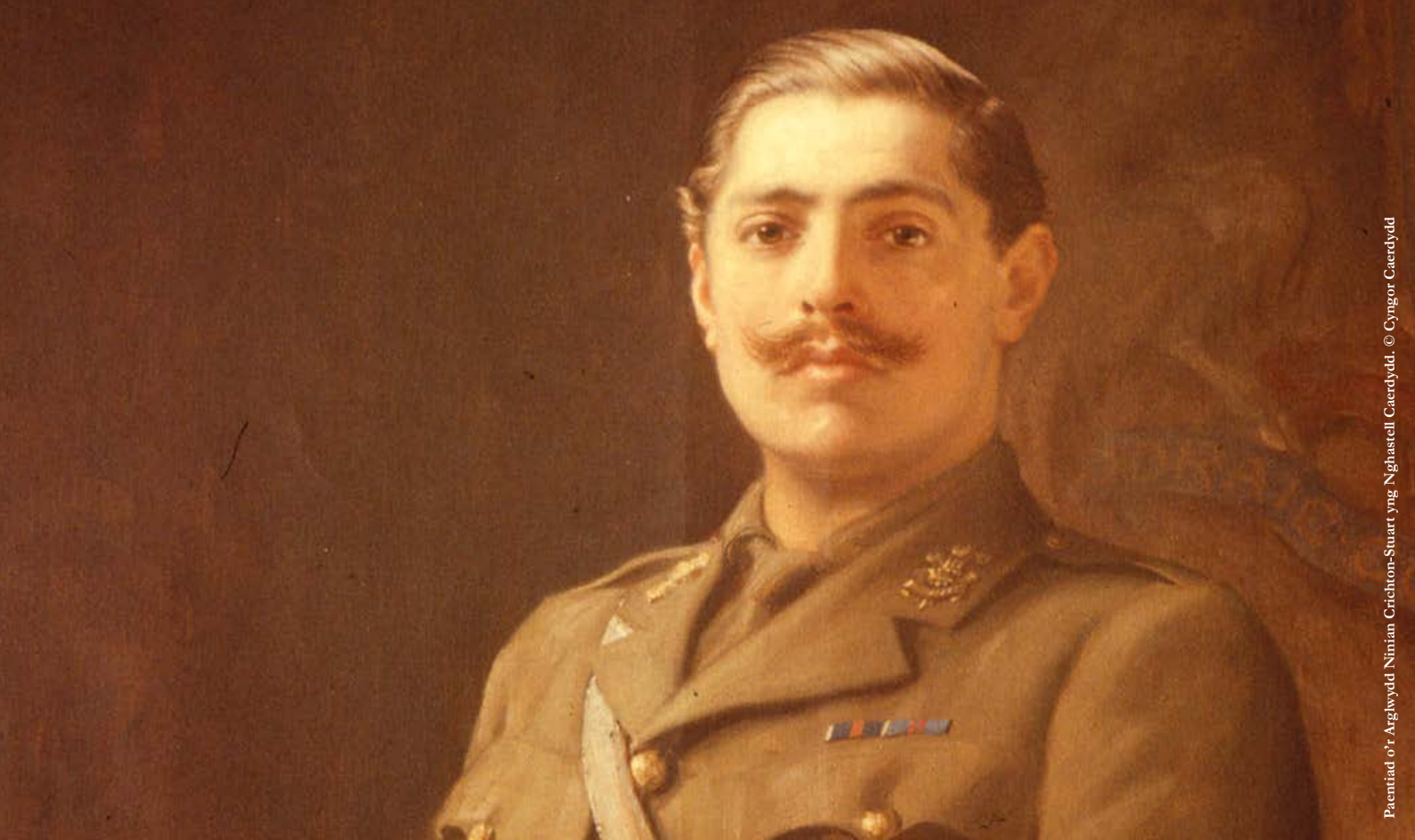
Pacntiad o'r Arglwydd Ninian Crichton-Stuart yng Nghastell Caerdydd.