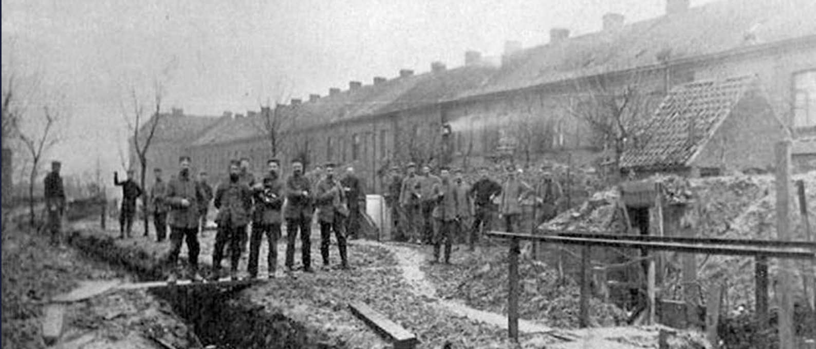
(uchod) Frelinghien.

rhywfaint o siflri yn eu plith, ond doedd dim gobaith eu cael i gyfeillachu â'i gilydd erbyn diwedd yr ail flwyddyn o ryfela.