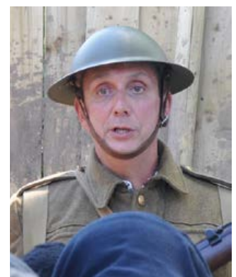
(brig y dudalen) Milwyr o'r 38ain Adran (Gymreig) yn Ffrainc ym 1916. (uchod) Prosiect ysgol ar y Rhyfel Byd Cyntaf - Ysgol Uwchradd Fitzalan, Caerdydd.