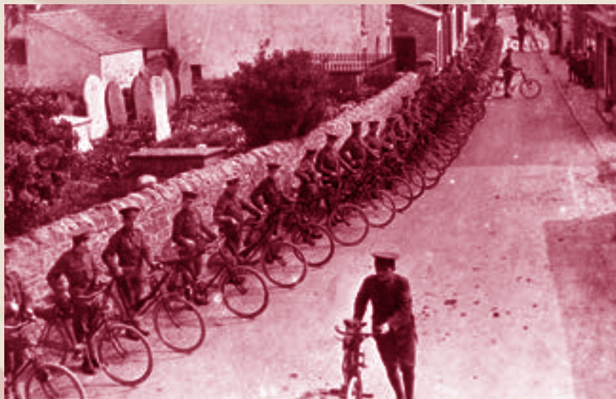
Milwyr o 7fed Bataliwn (Seiclwyr) y Gatrawd Gymreig gyda'u beiciau yn Llanilltud Fawr. Trwy garedigrwydd Amgueddfa Cymru (llun yn y cefndir) Pabiau. © Amgueddfa Cymru

Mae gan saith amgueddfa genedlaethol Cymru lawer o straeon i'w hadrodd ar sail y deunyddiau, y gwrthrychau, y ffotograffau a'r deunydd archifol arall sydd ganddynt eisoes. Er hynny, er mwyn deall yn well beth oedd effaith rhyfel ar fywyd yng Nghymru, mae Amgueddfa Cymru yn ymgysylltu â'r Cymry er mwyn ein helpu i ddarganfod ac adrodd y straeon hyn.