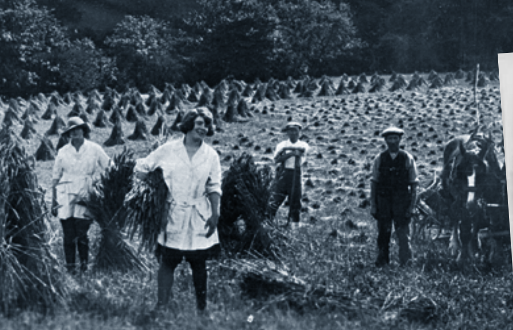
Menywod ym Myddin y Tir y yn gweithio ar y cynhaeaf 5d ym Mhowys, 1918.