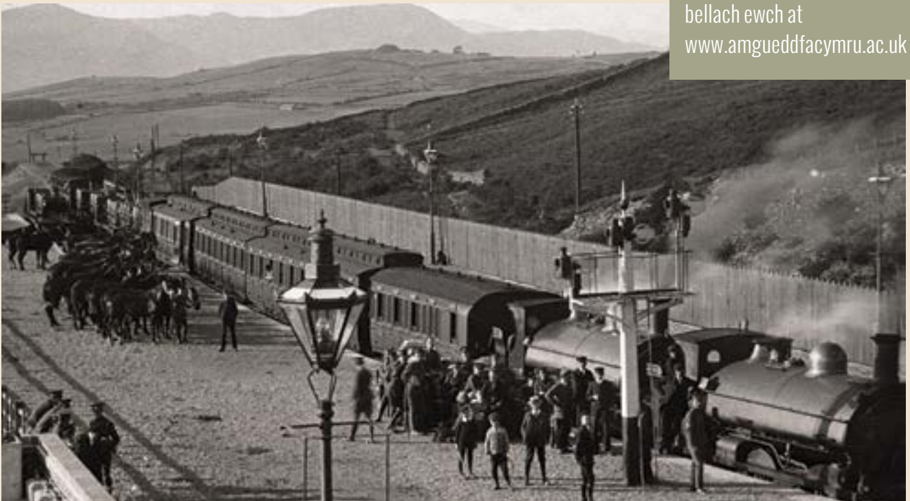
Milwyr â cheffylau yng ngorsaf drenau Trawsfynydd, tua 1916.

Am docynnau neu wybodaeth bellach ewch at www.amgueddfacymru.ac.uk