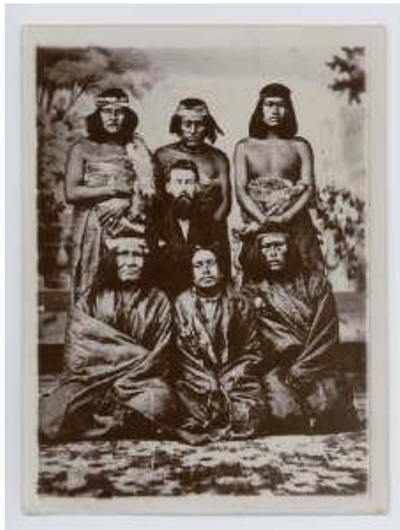
Lewis Jones (1836-1904) ymhlith Tehuelches, c.1867

Roedd y trefnwyr yn gwybod am fodolaeth y llwythau hyn cyn i'r fintai gyntaf o Gymry hwylio i Batagonia, er nad oedd sicrwydd sut fath o bobl oeddynt. Pwysleisiai Michael D. Jones y dylid trin brodorion Patagonia gyda phob tegwch a'u cydnabod fel perchnogion y tir. Cyfeiriai yn arbennig at yr esiampl a ddangoswyd gan William Penn ym Mhennsylvania yn yr ail ganrif ar bymtheg. Ym 1683 gwnaeth Penn gytundeb gyda brodorion Gogledd America na fyddai'r naill ochr yn defnyddio trais yn erbyn y llall. Dadleuai Michael D. Jones y dylai'r Cymry ymddwyn tuag at brodorion Patagonia yn yr un modd.