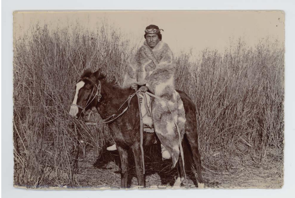
Un o frodorion Patagonia yn gwisgo mantell o grwyn gwanacod

Yn y 1880au, rhagfynegodd Michael D. Jones ddifodiant llwyth y Tehuelche, gan ddadlau mai trwy gydymffurfio â dulliau ymsefydlu'r Ewropeaid yn unig y byddai ganddynt unrhyw obaith o oroesi: