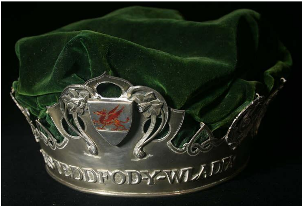
The crown of the Welsh Settlement's Eisteddfod

Pa symbolau o Gymru neu o Gymreictod a welwch ar y goron hon?