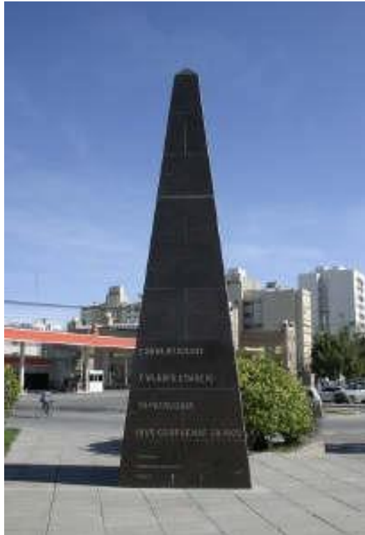
Cofgolofn yn Nhrelew i gofio canmlwyddiant y Wladfa Gymreig, 2005