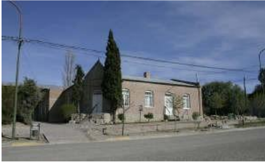
Ysgol Uwchradd Gaiman - Coleg Camwy, 2005

Ers ei sefydlu ym 1939, mae Cymdeithas Cymru-Ariannin wedi bod yn ddolen gyswllt bwysig rhwng Cymru a Phatagonia. Mae'n gymdeithas elusennol a daw ei hincwm yn gyfan gwbl oddi wrth ei haelodau. Defnyddir yr arian i hyrwyddo'r cysylltiad Cymreig drwy noddi teithiau cyfnewid i athrawon, myfyrwyr a gweinidogion. Noddir myfyrwyr o Batagonia i fynychu cyrsiau Cymraeg yn Llanbedr Pont Steffan bob haf. Hefyd, noddir cystadleuaeth flynyddol yn yr Eisteddfod Genedlaethol a sefydliadau addysgol ym Mhatagonia.