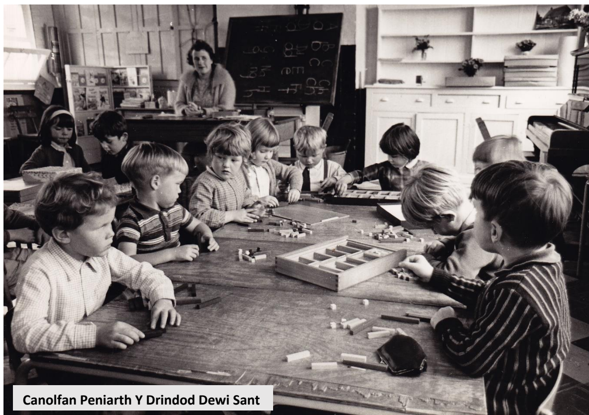
Canolfan Peniarth Y Drindod Dewi Sant

[Wedi'i addasu o Julie Heathcote, Memories are made of this: Reminiscence activities for person-centred care (Llundain: Cymdeithas Alzheimer's, 2009).]